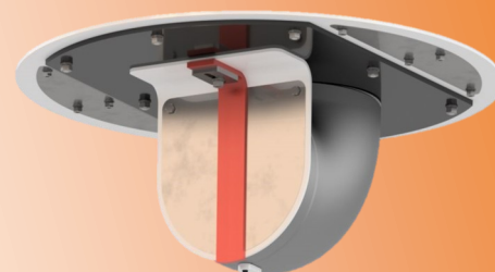
Ansicht von unten

GERUCH | FREMDWASSER | INGENIEURLEISTUNGEN