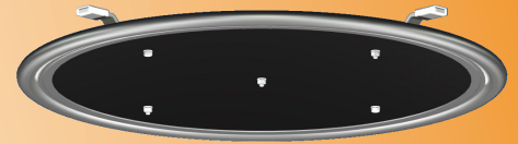
Ansicht von unten

GERUCH | FREMDWASSER | INGENIEURLISTUNGEN