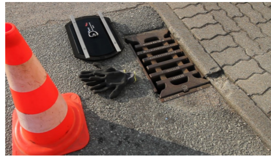
1. Havarieverschluss-System HVS-E bereitlegen

Für den Anwender sind alle eventuell notwendigen baulichen und verkehrsrechtlichen Voraussetzungen sowie die Einhaltung der Gesundheits- und Unfallverhütungsvorschriften sicher zu stellen.