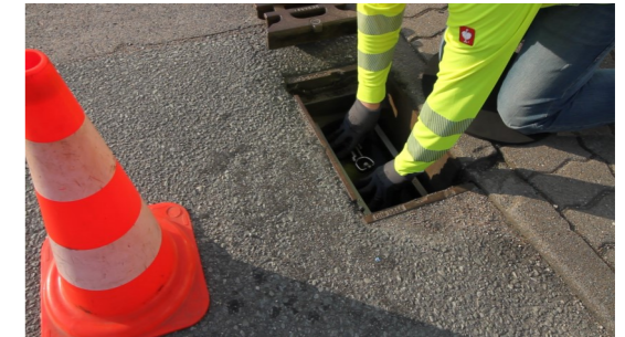
6. richtigen Sitz der Randdichtung überprüfen