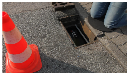
7. Gitterrost wieder einsetzen, fertig!