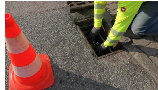
5. Havarieverschluss-System HVS-E in den Schachtdeckelrahmen herunterdrücken