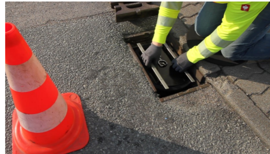
4. Havarieverschluss-System HVS-E mit leichter Kippbewegung einsetzen