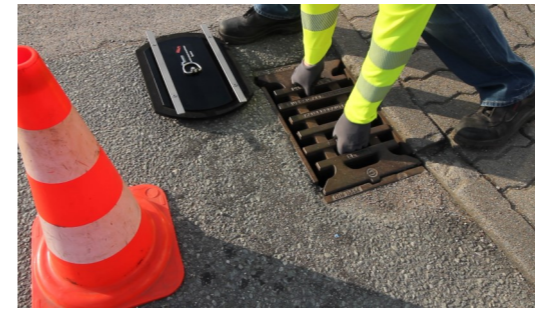
2. Gitterrost entnehmen