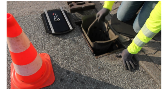
3. Schmutzeimer entnehmen (Schmutzeimer wird nicht mehr benötigt)