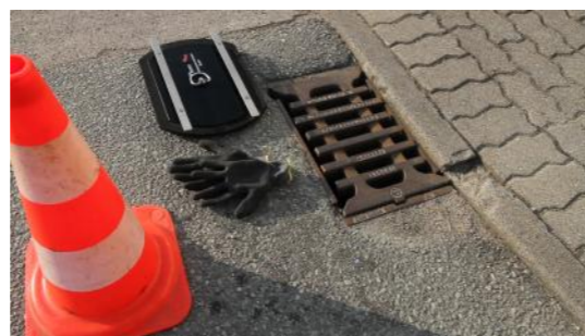
1. Havarieverschluss-System HVS-E bereitlegen

Für den Anwender sind alle eventuell notwendigen baulichen und verkehrsrechtlichen Voraussetzungen sowie die Einhaltung der Gesundheits- und Unfallverhütungsvorschriften sicher zu stellen.