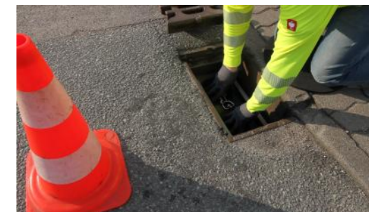
6. richtigen Sitz der Randdichtung überprüfen