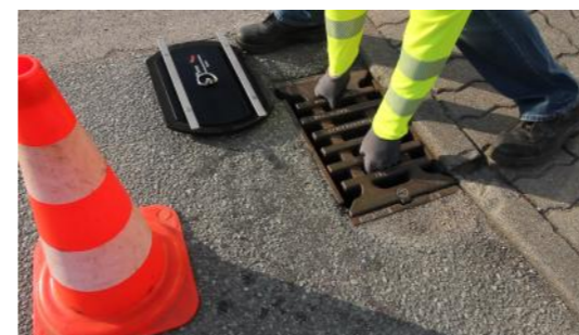
2. Gitterrost entnehmen