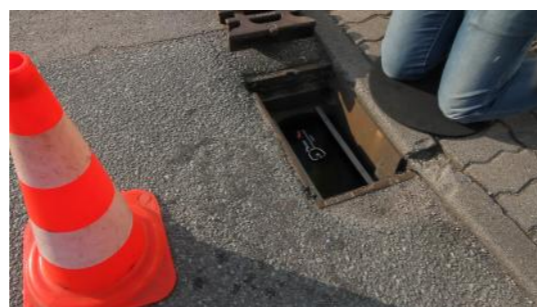
7. Gitterrost wieder einsetzen, fertig!