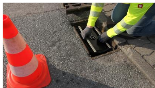
4. Havarieverschluss-System HVS-E mit leichter Kippbewegung einsetzen