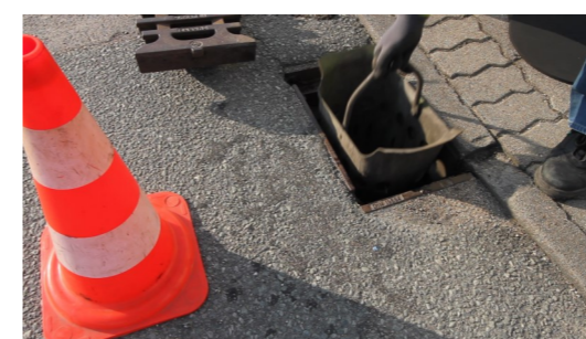
7. Schmutzeimer wieder einsetzen