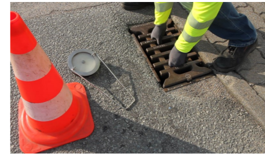
2. Gitterrost entnehmen

(vergl. Einbauanleitung Geruchsverschluss-System GVS-K3)