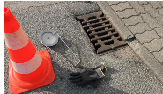
1. GVS-K3-R bereitlegen

Für den Anwender sind alle eventuell notwendigen baulichen und verkehrsrechtlichen Voraussetzungen sowie die Einhaltung der Gesundheits- und Unfallverhütungsvorschriften sicher zu stellen.