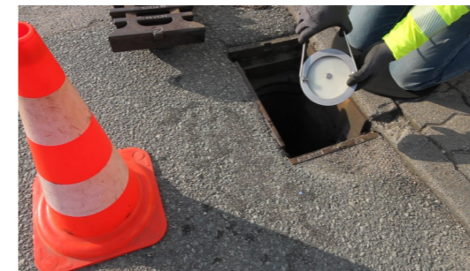
4. GVS-K3-R mit der Hand oder mit der Hilfe des Einbauwerkzeuges greifen (beim Greifen mit der Hand den Bügel etwas zusammendrücken um das Pendeln des Grundkörpers zu vermeiden)