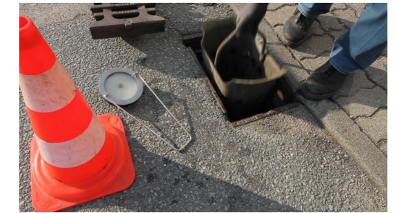
3. Schmutzeimer entnehmen