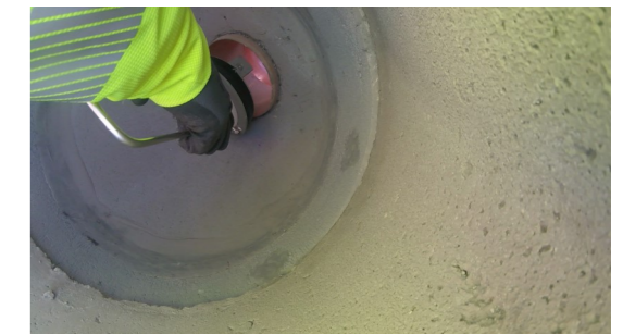
5. GVS-K3-R bis zum Anschlag in das Ablaufrohr hineinschieben