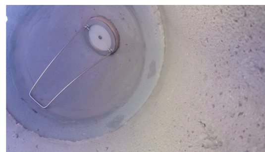
6. Sicherungsbügel umlegen und herunterdrücken