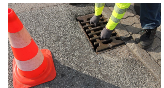
8. Gitterrost wieder einlegen