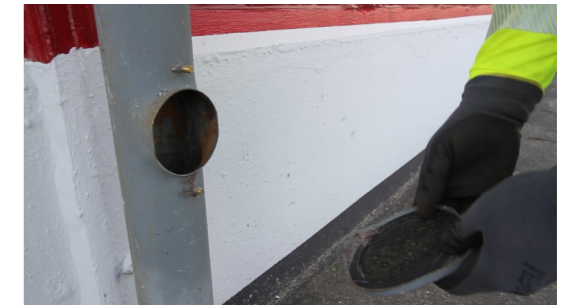
3. Revisionsklappe abnehmen