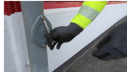
2. Schrauben der Revisionsklappe lösen