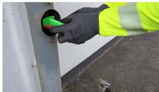
5. GVF-100 durch Revisionsöffnung einsetzen