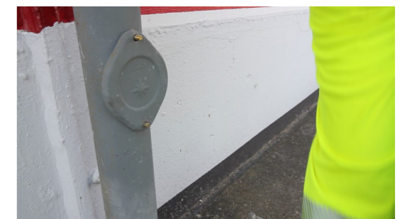
7. Revisionsklappe wieder aufsetzen