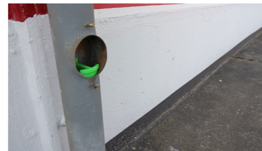
6. GVF-100 platzieren