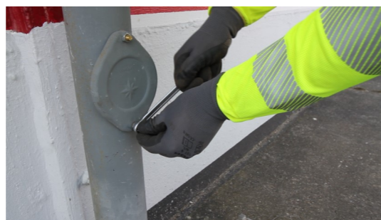
8. Schrauben der Revisionsklappe wieder festziehen