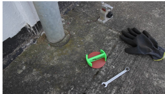
1. GVF-100 und Ring-/Maulschlüssel bereitlegen