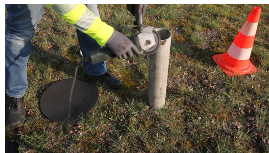
4. Schnittkanten entgraten und glätten