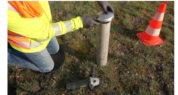
3. Regenhaube des vorhandenen Abluftrohres entfernen