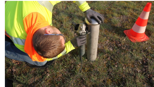
2. Regenhaube des vorhandenen Abluftrohres abtrennen