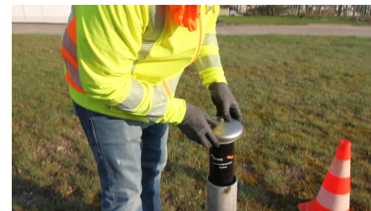
5. Geruchsdämpfungspatrone in das Abluftrohr einsetzen