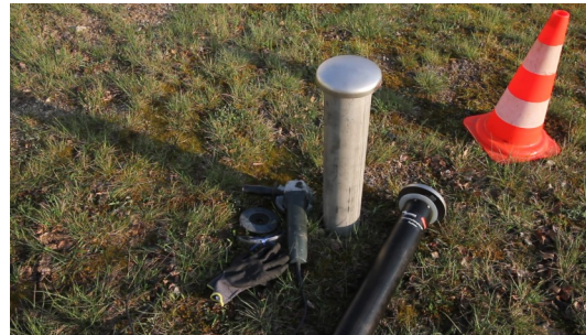
1. Geruchsdämpfungspatrone bereitlegen