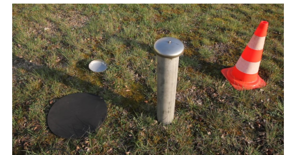
6. richtigen Sitz der Randdichtung prüfen, fertig!