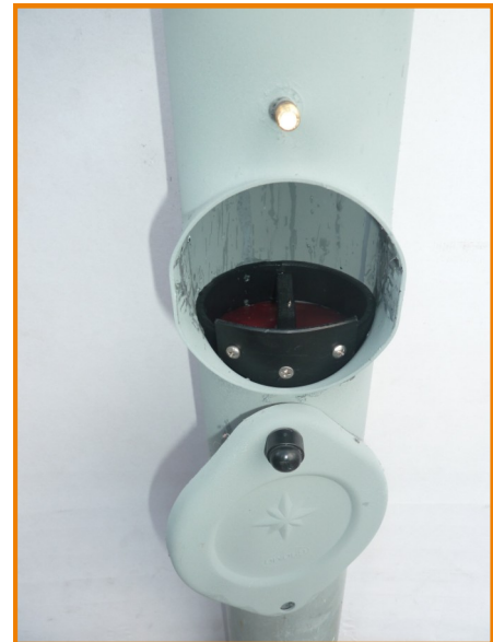
GVF-100 in Regenfallrohr eingesetzt