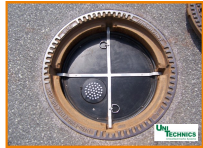
GDS FVAK in Schacht eingebaut