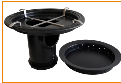
WVS FRK-3 mit SF-3