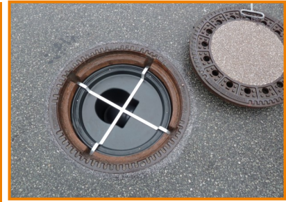
WVS FRK-3 in Schacht eingebaut